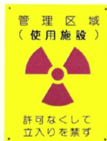
写真②管理区域 (使用施設)標識